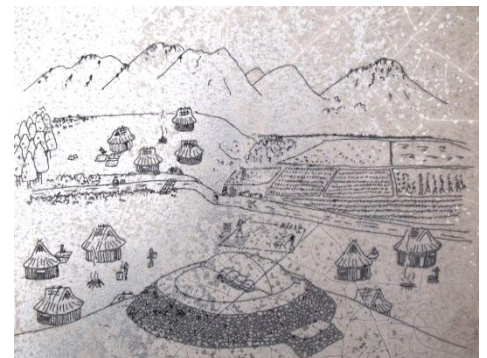
18号古墳のある古代の風景の想像図が、ふるさと歴史公園にあります