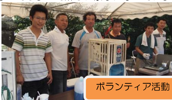
ボランティア活動