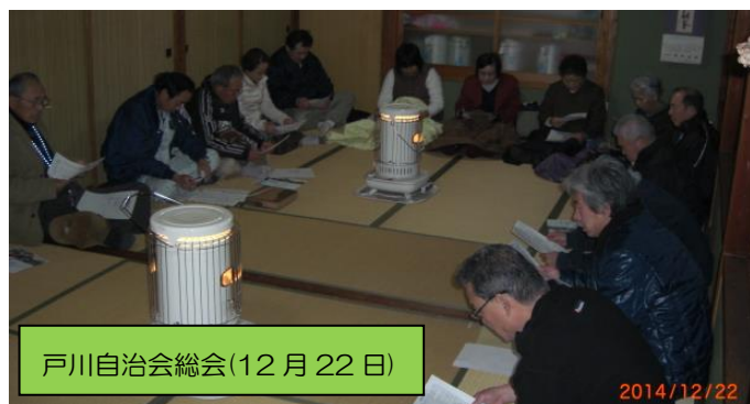
戸川自治会総会(12月22日)