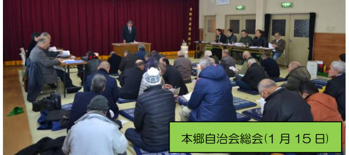
本郷自治会総会(1月15日)