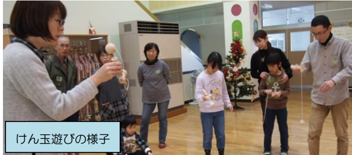
けん玉遊びの様子

当日は、子供会のクリスマス会に合わせて午前中はツリーの飾り付けやケーキ、盒食作りをされました。食事の後は、羽根つきやけん玉、コマ回しの昔遊びをして大人と子供が触れ合う楽しい1日を過ごされました。