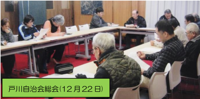
戸川自治会総会(12月22日)