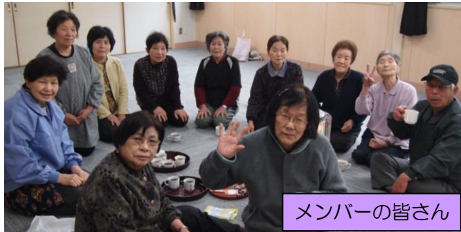
メンバーの皆さん