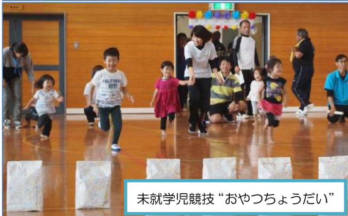
未就学児競技“おやつちょうだい”