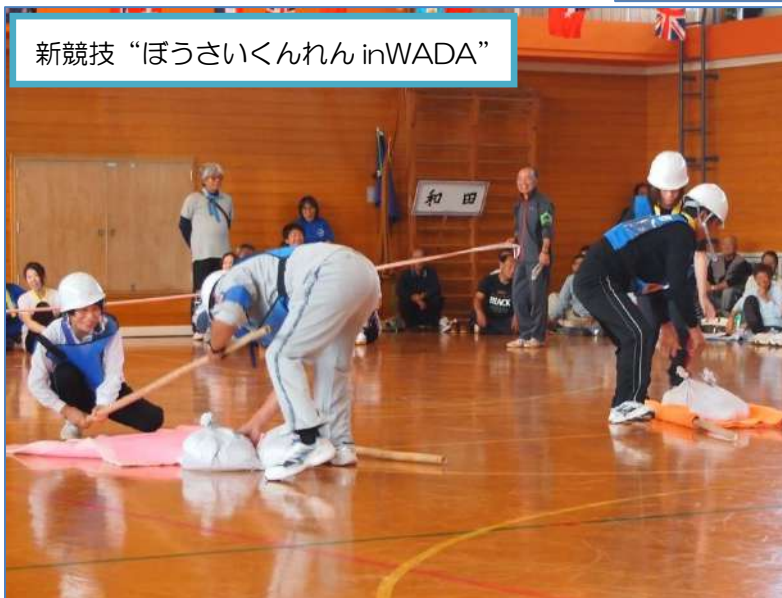
新競技“ぼうさいくんれん inWADA”

来年度も、一人でも多くの方に参加頂ける運動会を目指してまいりますので、ご協力よろしくお願いたします。