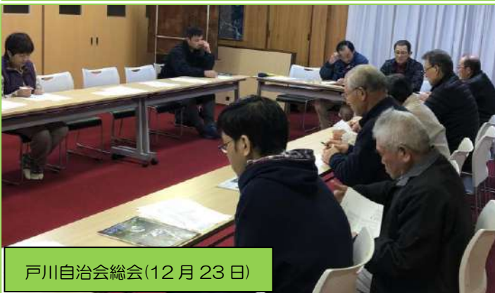
戸川自治会総会(12月23日)