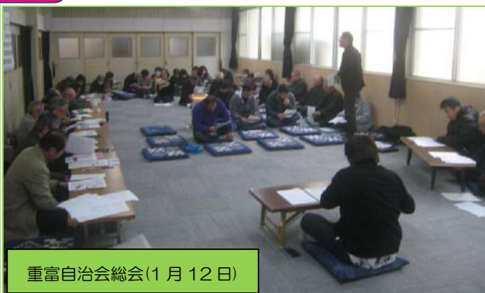
重富自治会総会(1月12日)