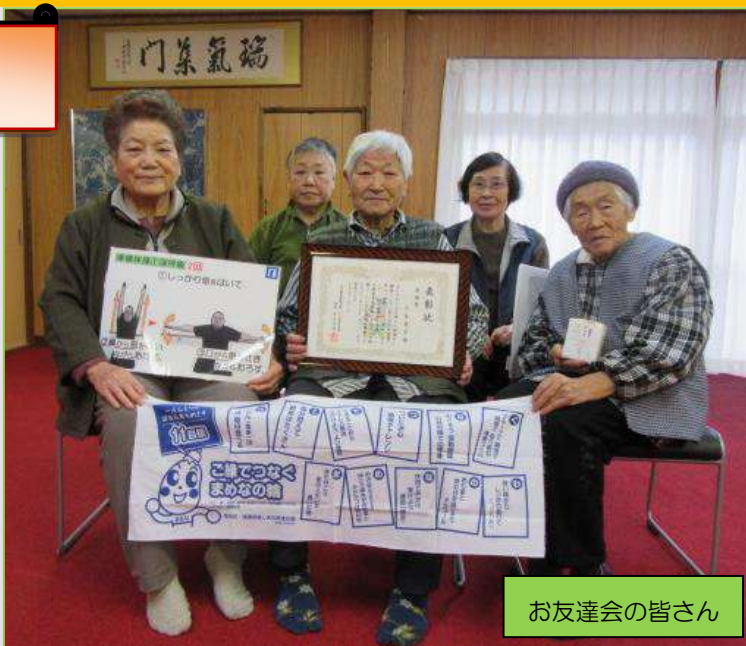
お友達会の皆さん

12月12日に、浜田合同庁舎にて健康づくりグループ表彰が行われ、戸川の“お友達会”の皆さんが“浜田圏域健康長寿しまね推進会議奨励賞”を受賞をされました。この表彰は、運動中心で栄養に気をつけた食生活且つ生きがいづくり、また活発に活動されていることが評価されるそうです。お友達会の皆さんおめでとうございます！！