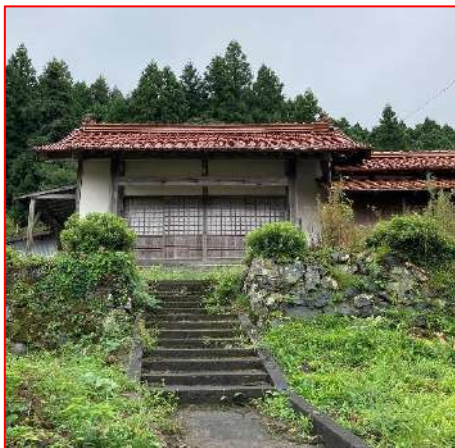
醫王寺 後の 神宮寺祈禱所

現在の和田町の南、旧庄屋喜久屋（大屋氏）宅のそらに醫王寺はあった。その建物は明治になって和田村役場に使用されており現在その跡地に神宮寺と称する祈禱所（佐々森ハツヨ現在）がある。