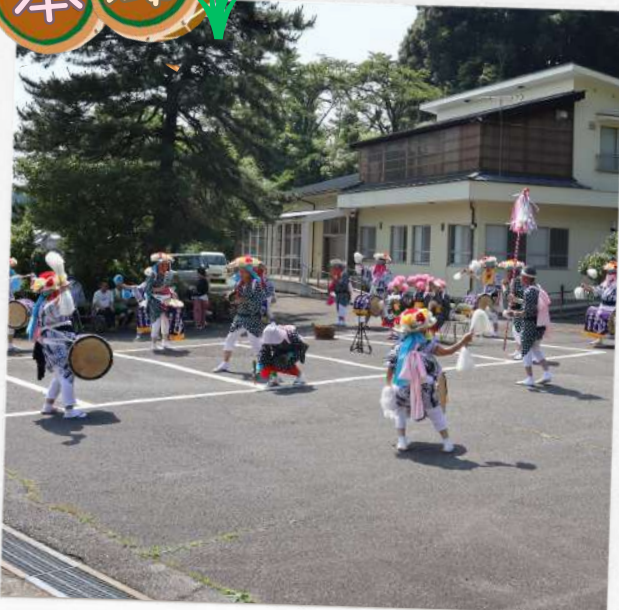
6/18(日)に、4年ぶりの田囃子が催され ました。今年は、早乙女役の1人に男性が挑 戦されました♪