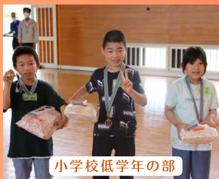
小学校低学年の部

6月11日(日)に、フリースロー大会がありました。旭町内の小学校低学年から中学生のあわせて22人が参加し、予選は体育館、決勝はまちセンに完成したハーフコートで行われました。皆さん、真剣かつ集中してシュートされていました！入賞者には、記念メダルと賞品が贈られました。