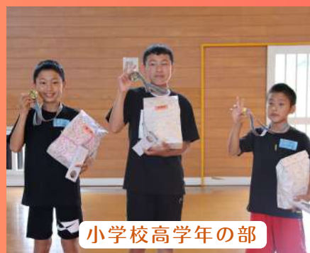
小学校高学年の部