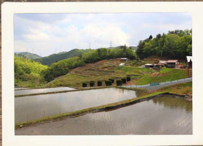
棚田が並ぶ初夏の柏尾谷 すいせい