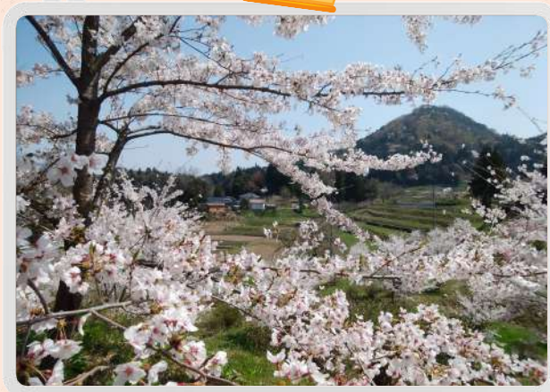
春の尼御前山 キウイ