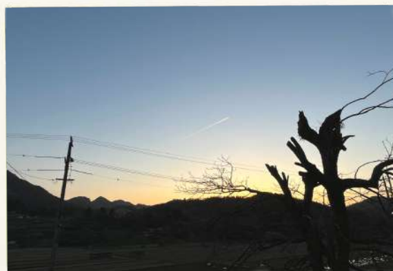
This is 重富 somaですよ