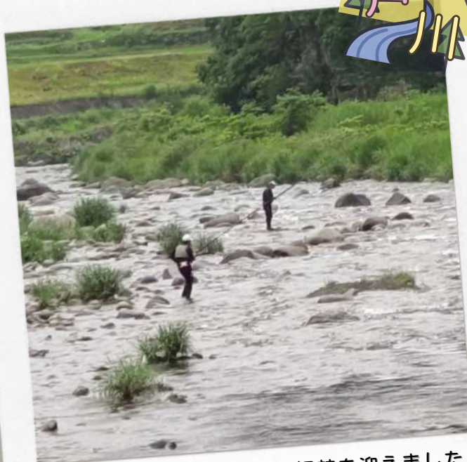
6/10(土)に、鮎釣り解禁を迎えました！ 今年、解禁日2日前からテントを張られて いた人もおられたそうです。