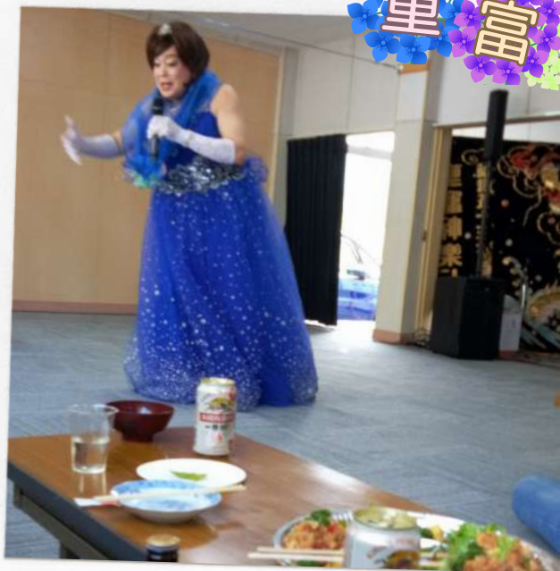
6/18(日)に、4年ぶりにあじさい祭りが ありました。今年は、美空ひばりショーを楽 しまれました♪