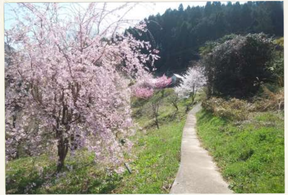
春の散歩道 ほととぎす