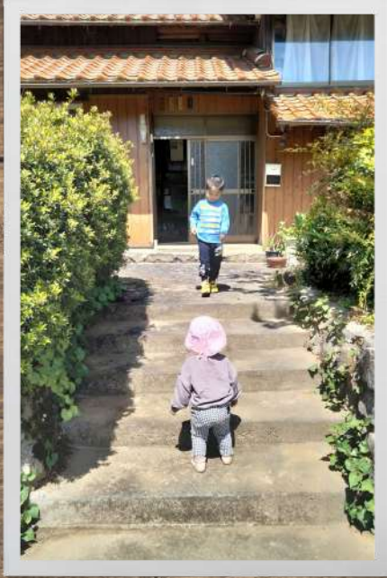
にーた、おーで スヌーピー