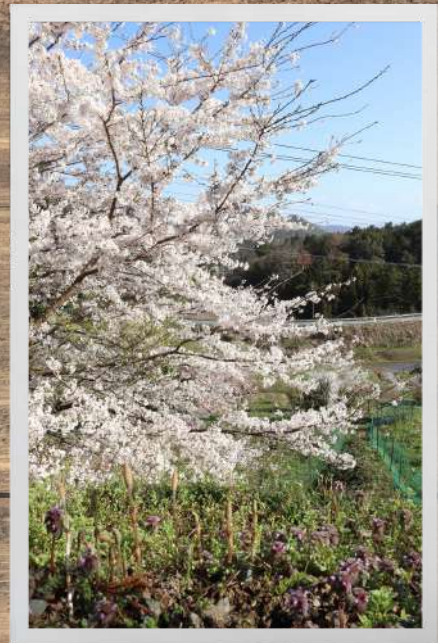
土居谷の桜を眺めるつくしちゃん ダークネス