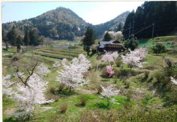
耕作放棄地を彩る花々 ひまわり