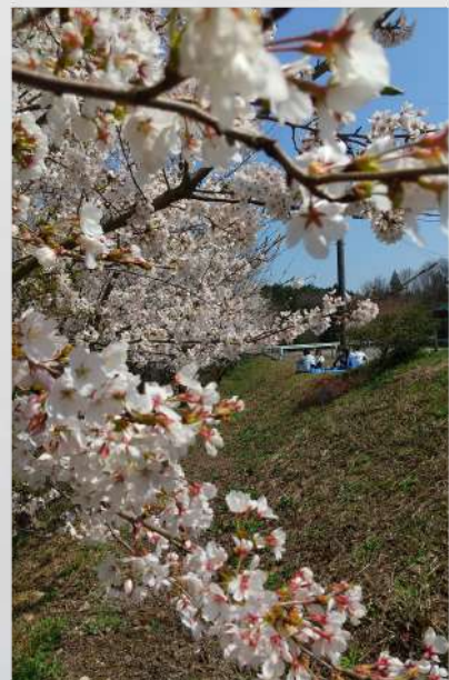
ポカポカ 鷹の爪団