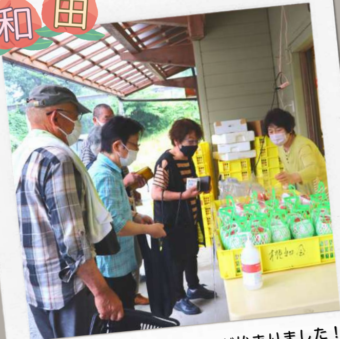
和田の選果場で桃の初出荷が始まりました！ 旬の味を、皆さん、ぜひご賞味下さい♪