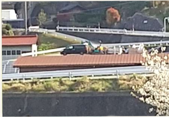
屋根の上に車！ 鷹の爪団