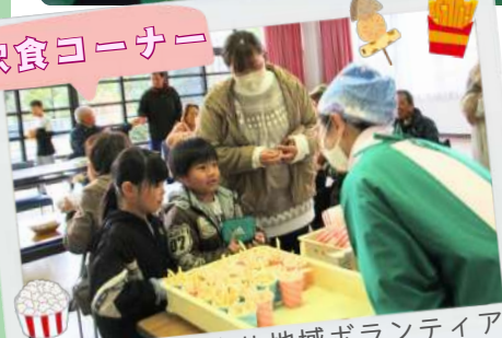
親和会のおでんや地域ボランティアのポテト等も販売されました♪

当日は、和田にもこんなに子どもがいるの？と思わせるくらい、ちびっ子達が走り回り、活気のある大会となりました。また、今回は飲食コーナーもしっかりと楽しんでいただけるよう、開演時間を12時に変更しての開催となりました。