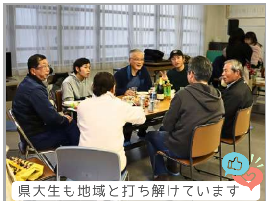
県大生も地域と打ち解けています

このような会を形をかえて繰り返していく中で、「まちづくり」の種(まちづくりにつながるアイデア)をじっくりと育てていきたいと考えています。