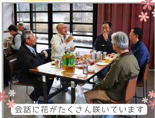
会話に花がたくさん咲いています

第2回農村RMO講演会のときに、参加者から「 たくさんの方が集まって、自分たちの思いを語れるような場がほしい。 」ということになりました。そのアイデアを受けて、総務企画部会で話し合ったところ、年末に「 みんなが集まれるような会を開こう。 」ということになりました。いきなり地域住民全員というのは無理なので、まず現在のまちづくり委員会に関わっていらっしゃる方を中心に声をかけようということになり、和田まちづくりセンターで、「 みんながより親しくなれて、どんなことを思っているか語り合う集会 」を開きました。当日は、県立大学生も数名招いて、今どきの若者の視点で、和田地区について感じることを話してもらいました。