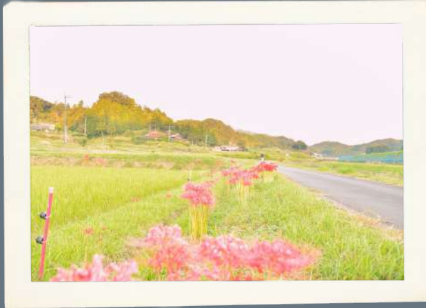
● 陽だまり散歩 ● ● 甘生堂 ●