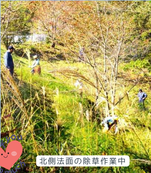
北側法面の除草作業中