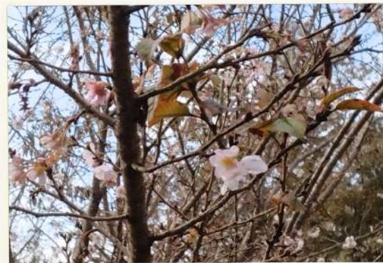
● 季節外れのさくら② ● ● コダワリ ●