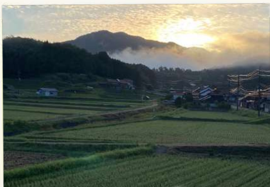
● 秋の雲海 ● ● ちょい悪爺さん ●