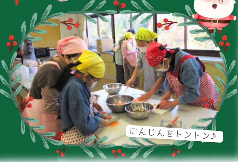
にんじんをトントン♪