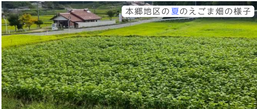
本郷地区の夏のえごま畑の様子

5月中旬の播種からスタートした令和6年産のえごま栽培ですが、11月末をもって作業の全てが終了しました。今年は、ここ数年続く夏場の猛暑の影響もあり、目標としていた300kgを下回る200kgの収穫量となりました。