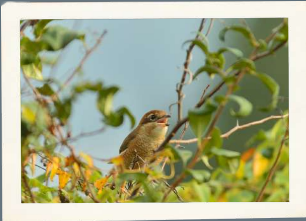
● 木瓜と百舌 (ボケとモズ) ● ● 甘生堂 ●