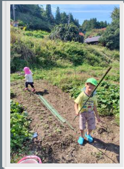
● いけん事している子はどっち ● ● スヌーピー ●