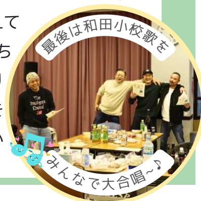
最後は和田小学校歌を

このような会を形をかえて繰り返していく中で、「まちづくり」の種(まちづくりにつながるアイデア)をじっくりと育てていきたいと考えています。