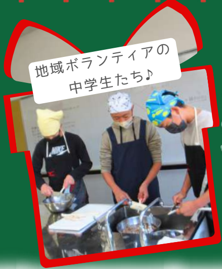
地域ボランティアの中学生たち♪