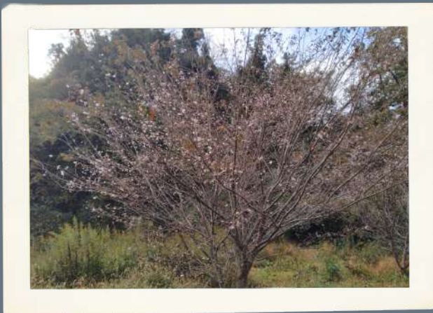
● 季節外れのさくら① ● ● コダワリ ●