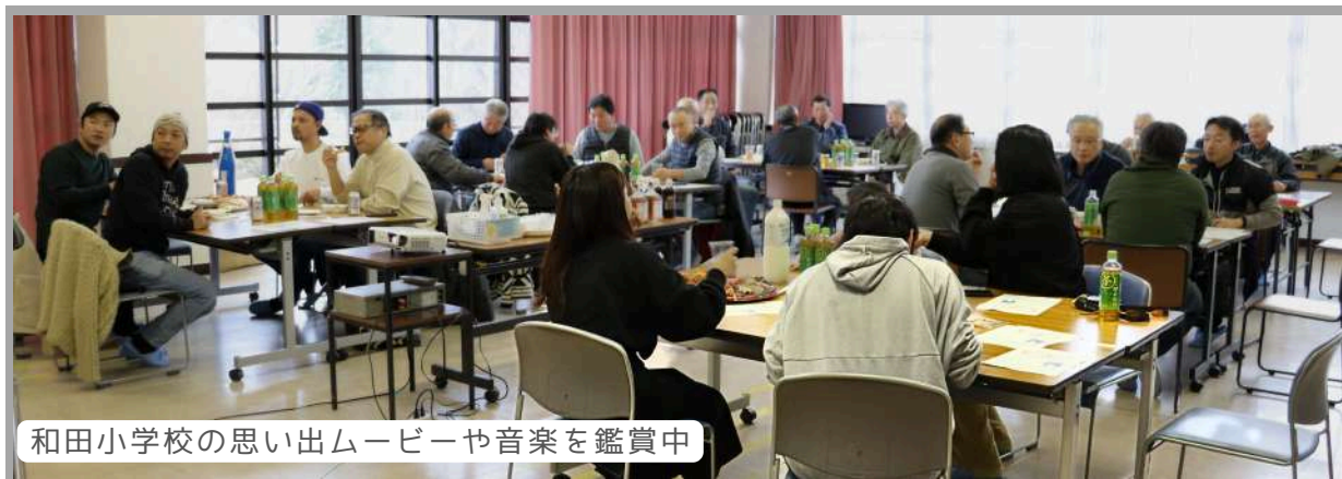
和田小学校の思い出ムービーや音楽を鑑賞中