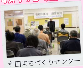
和田まちづくりセンター

令和8年度通常総会が行われ、28名が出席されました。より住みよい和田地区となるよう地域の課題や活性化など、皆さんと一緒にまちづくりを進めていこうと思いますので、ご意見やアイデアなど遠慮なくお申し出ください。